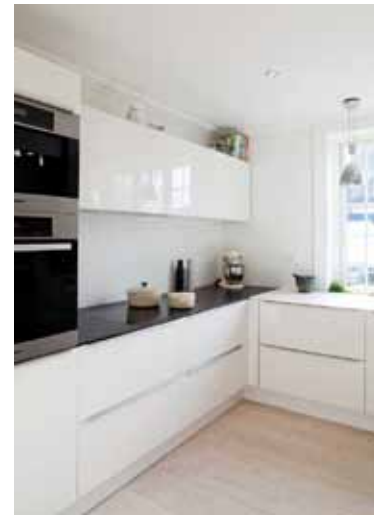
Ejemplos gráficos de la combinación estética de éstos elementos