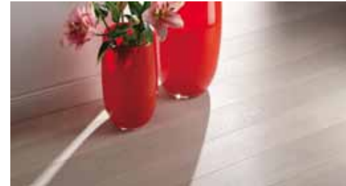
Ejemplos gráficos de la combinación estética de éstos elementos